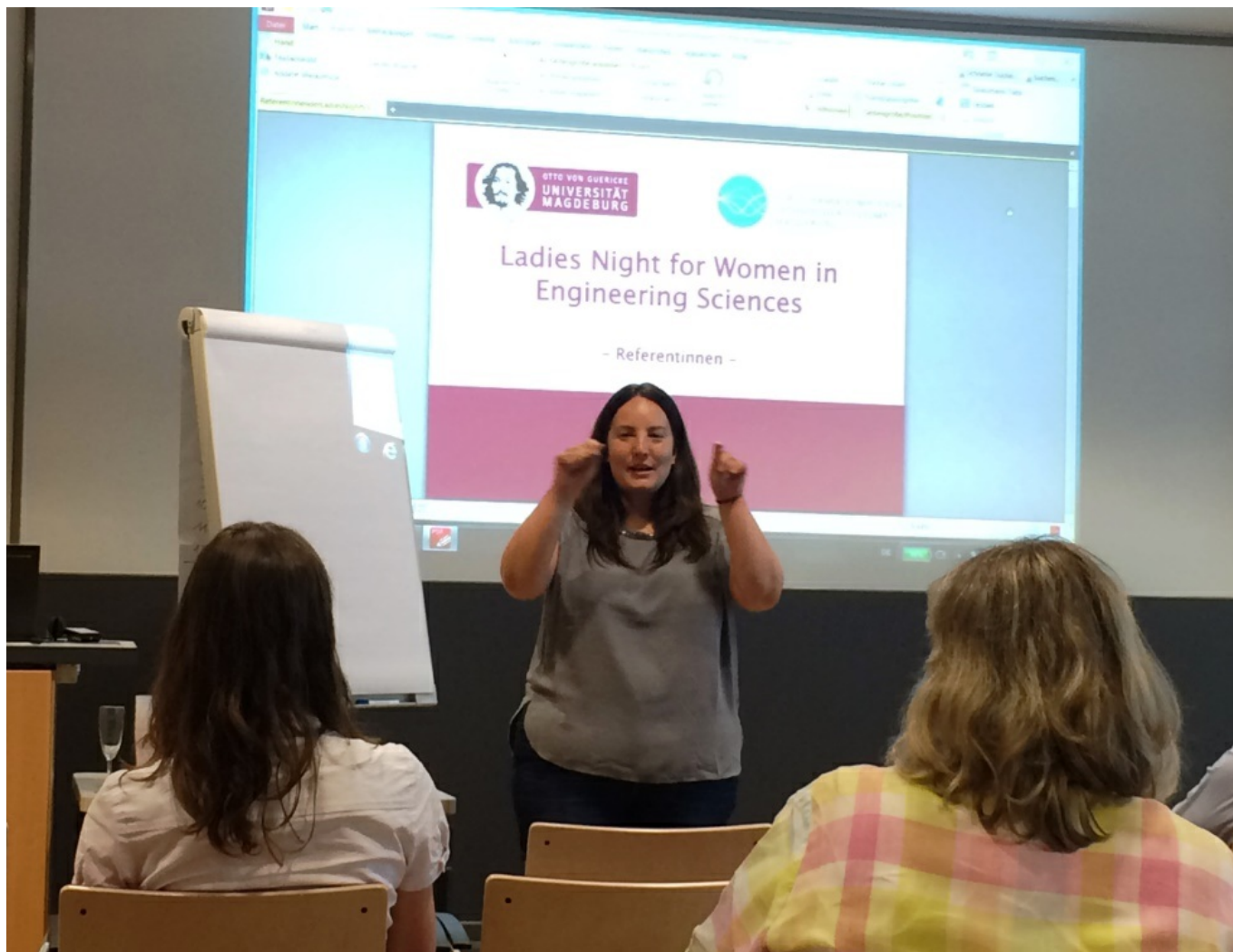
19. April 2018 - 5. Ladies Night for Women in Engineering Sciences