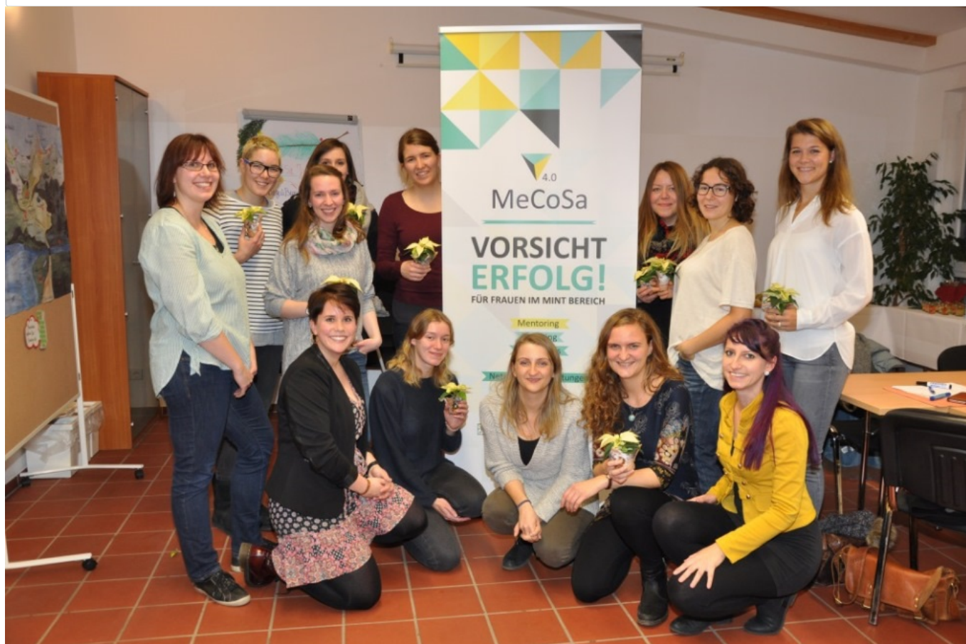
27. November 2018 - Abschluss-Abschieds-Vorweihnachtsfeier

MeCoSa 4.0 ist ein Projekt der Koordinierungsstelle Genderforschung und Chancengleichheit Sachsen-Anhalt und wurde durch den Europäischen Sozialfonds (ESF) gefördert. Es endete am 31.12.2018.