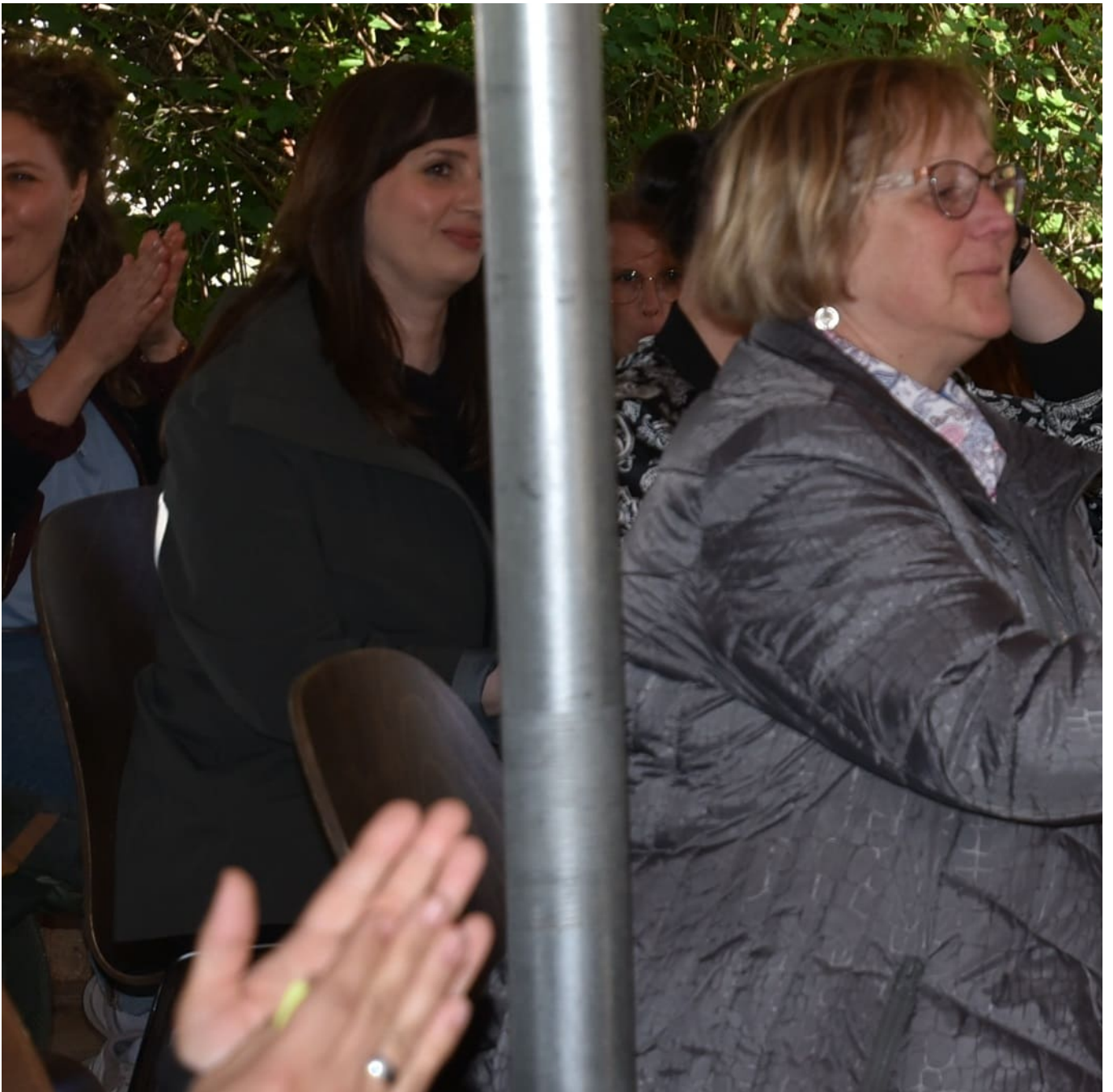
Kompaktes Extrawissen über die KGC und ein fleißig mitratendes Publikum