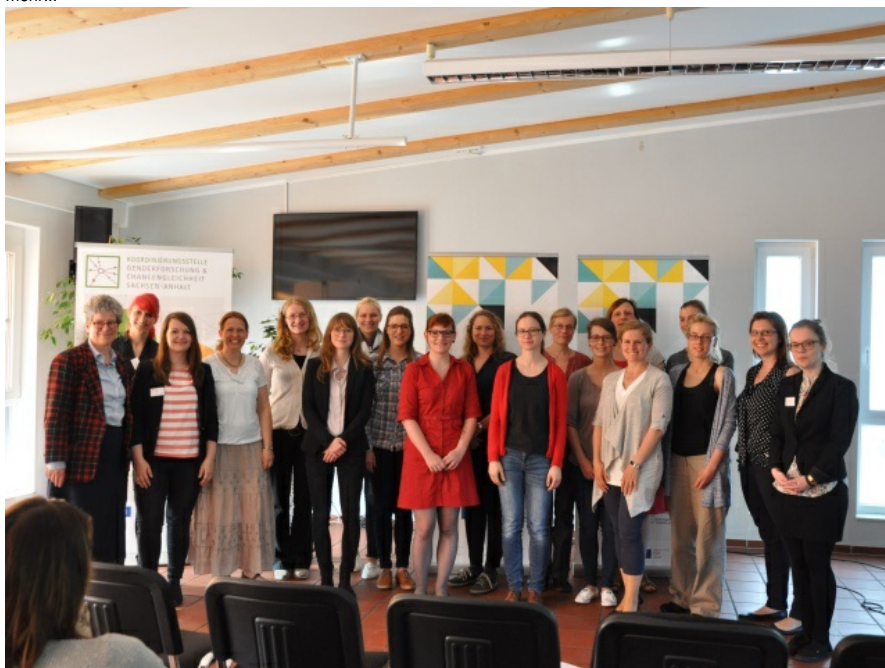
15. Mai 2017 - Abschlussveranstaltung