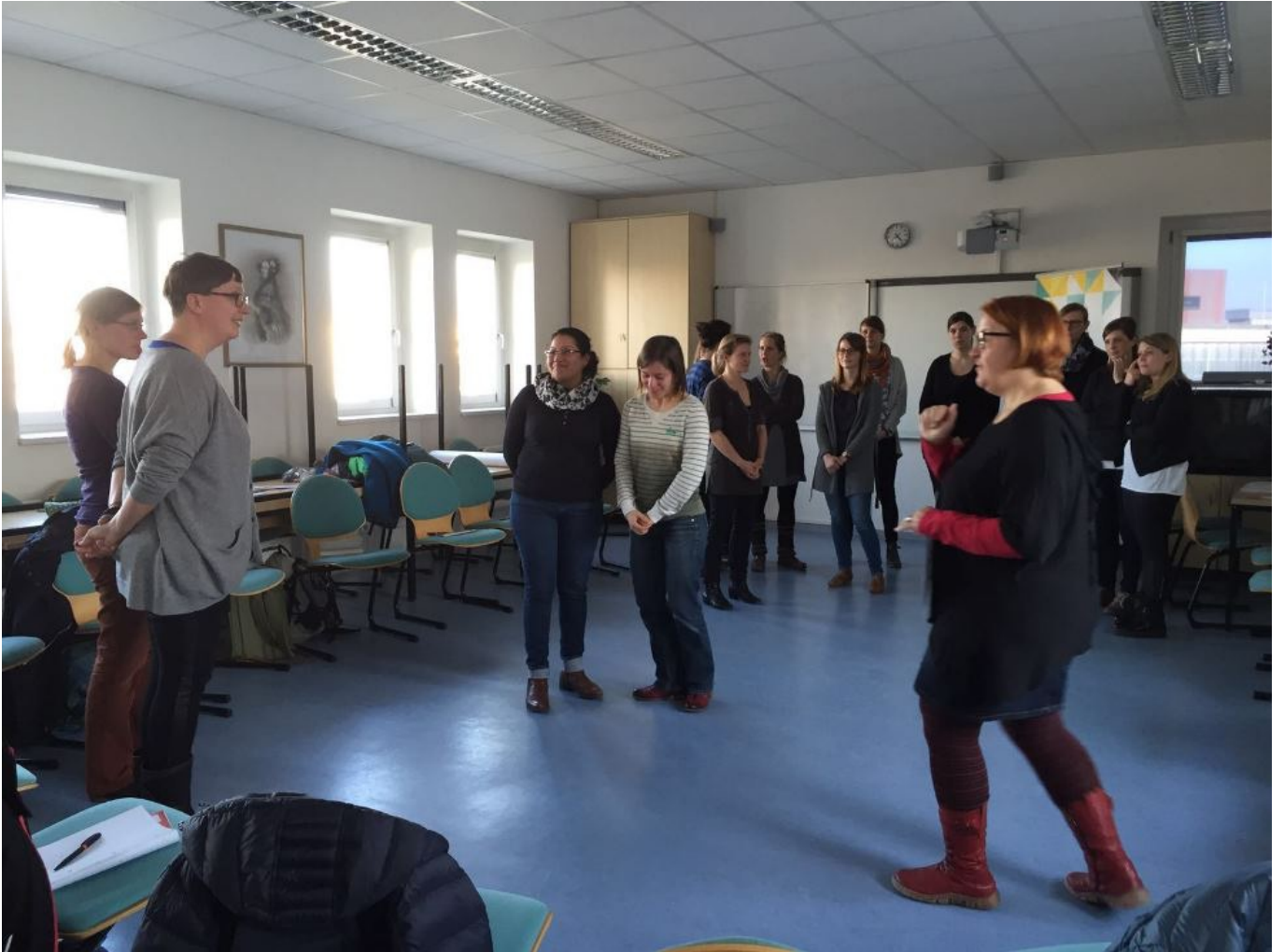
Impressionen zum Coaching-Auftakt in MeCoSa 4.0 am 17. März 2016