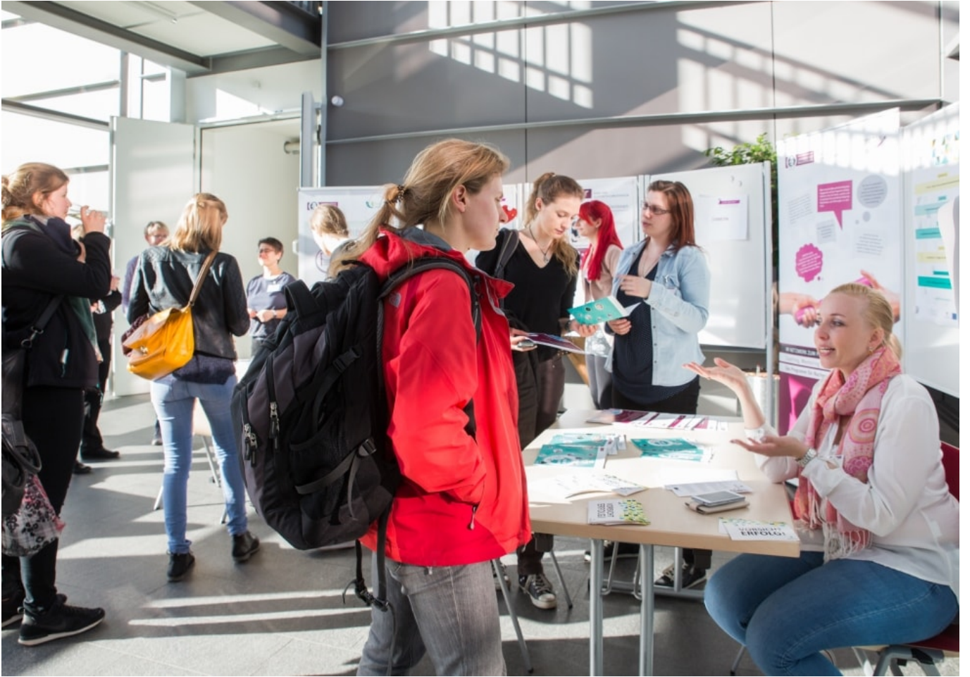
19. April 2016 - 3. FVST Ladies Night for Women in MINT