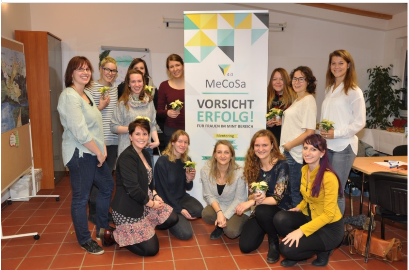
27. November 2018 - Abschluss-Abschieds-Vorweihnachtsfeier

MeCoSa 4.0 ist ein Projekt der Koordinierungsstelle Genderforschung und Chancengleichheit Sachsen-Anhalt und wurde durch den Europäischen Sozialfonds (ESF) gefördert. Es endete am 31.12.2018.