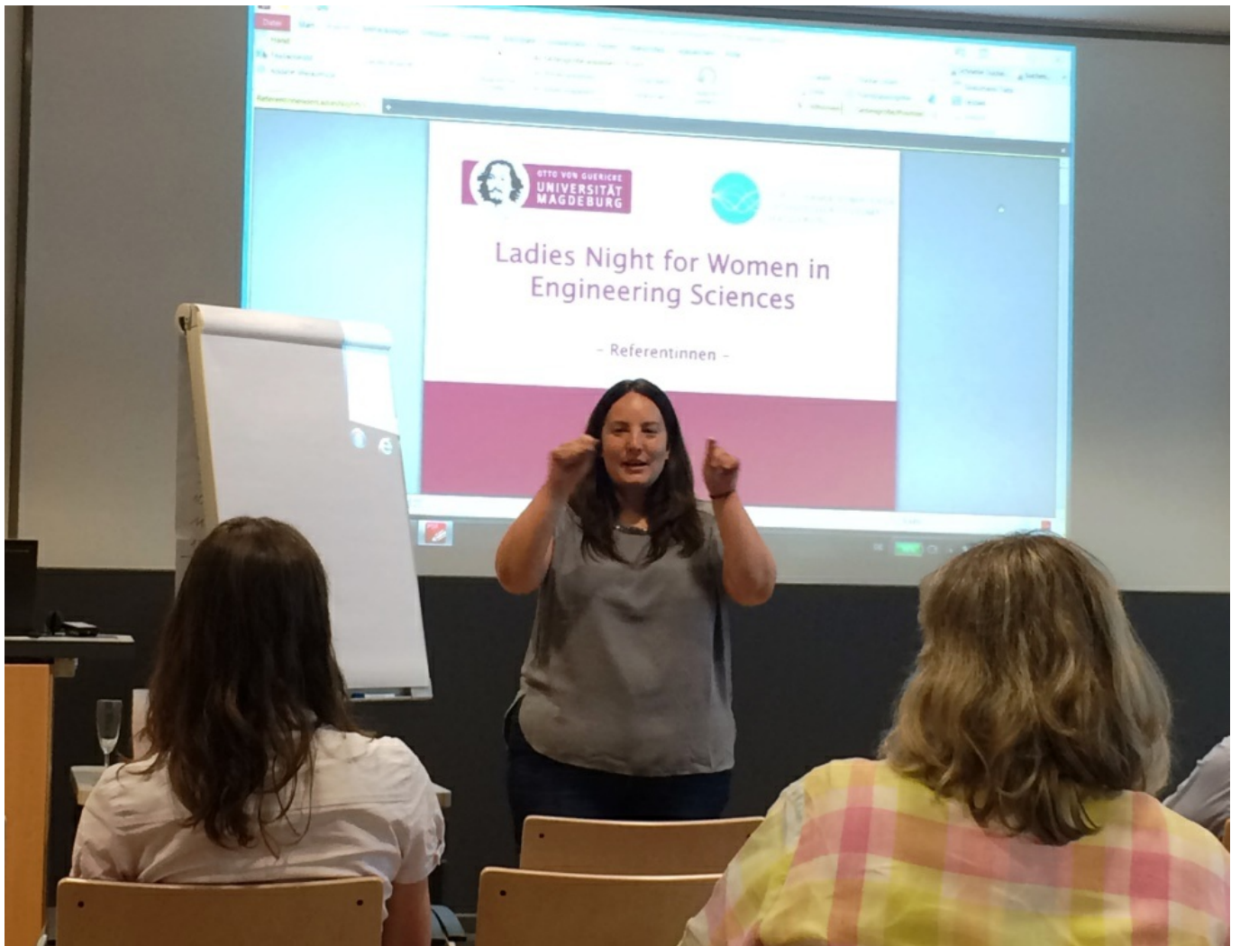
19. April 2018 - 5. Ladies Night for Women in Engineering Sciences