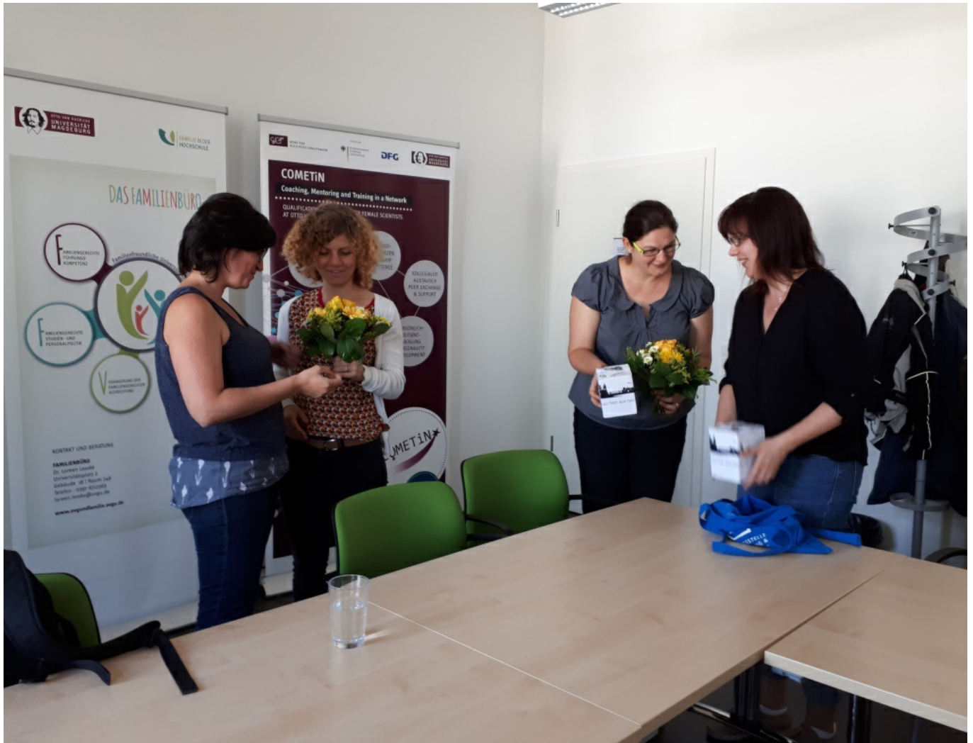
27. Juni 2018 - „VON SOWEIT HER BIS HIERHIN - VON HIER AUS NOCH VIEL WEITER“ Internationale Karrierewege mit Familie