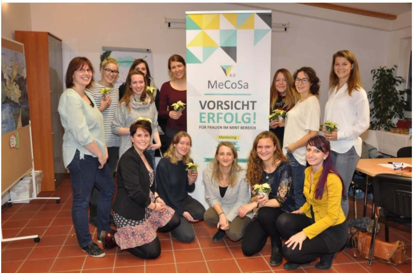
27. November 2018 - Abschluss-Abschieds-Vorweihnachtsfeier

MeCoSa 4.0 ist ein Projekt der Koordinierungsstelle Genderforschung und Chancengleichheit Sachsen-Anhalt und wurde durch den Europäischen Sozialfonds (ESF) gefördert. Es endete am 31.12.2018.