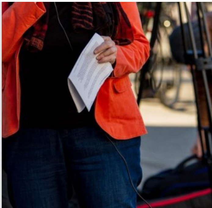
nRising_Eröffnung_Gleichstellungsbeauftragte Stadt onitka (Bild 2 von 5) » Vorwärts