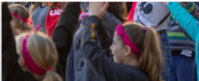
lashmob_14.02.2019 (Bild 1 von 5) » Vorwärts