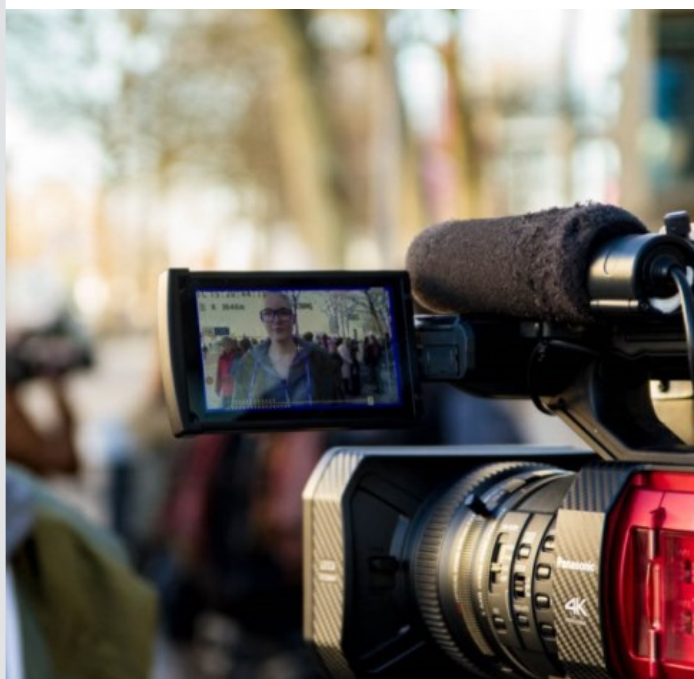
n-Rising-2019-Magdeburg (Bild 3 von 5) » Vorwärts