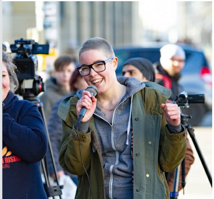
n Rising Magdeburg 2019_Kundgebung (Bild 5 von 5)

kt › intoMINT 4.0 ( https://www.kgc-sachsen-joesLSA.html ) ging es in diesem Monat mit einem wichtigen Schritt in den Start. Beim konstituierenden Beiratstreffen wurde das Projekt den Beiratsmitgliedern vorgestellt. Die Expert*innen aus Wirtschaft und Wissenschaft geben wertvolle Anregungen für die Weiterentwicklung der App zur gendersensiblen App für Frauen* und Mädchen*.